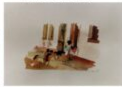
il corno 1987