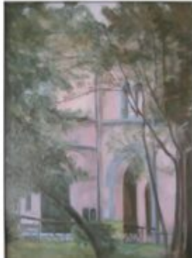
2000 a spatolare su acquarello 2002-2007