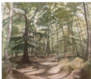
Bosco di cerri 2014 cm 90x100