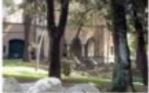
Palazzo di Strobl-Ferr