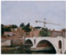
Ponte Principe Amedeo 1999 cm. 50x60