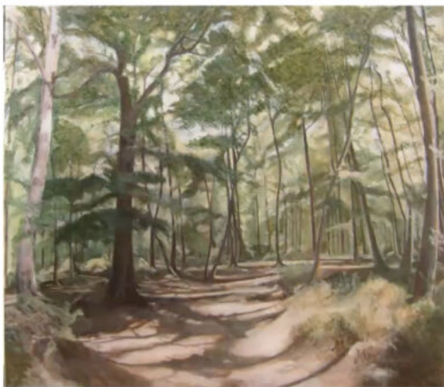
Bosco di cerri 2014 cm 90x100