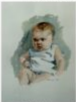
il latte 1987