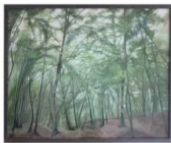
Bosco di faggi 2020 cm 65x80