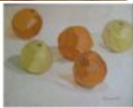
le ombre 1995 - cm 24x30