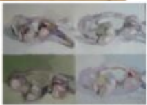
bianco su bianco 1991 cm 25x30