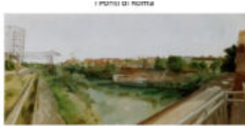
I ponti di Roma