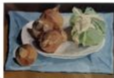
naturamorta 1992 cm 24x30