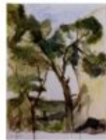
il pino 1995