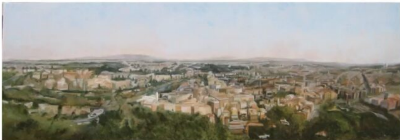
Roma e il suo fiume 2014 cm 35x105