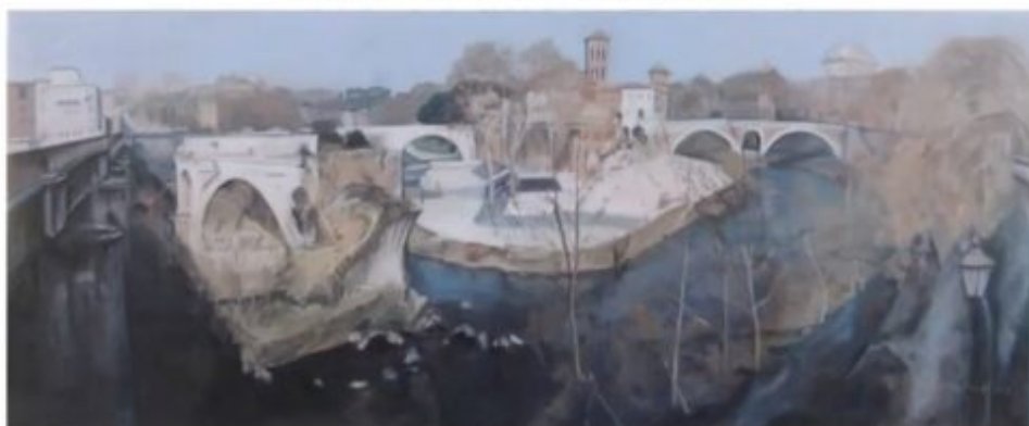
Isola Tiberina 2014 cm 40x100

3° premio del Premio Nazionale di Pittura "Città di Fondi" Maurizio Calvesi (Presidente della Giuria).